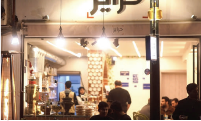
الفرع الثاني - [زيونة شارع دريم سيتي] Branch 2 – Zayouna, Dream City Mall Street