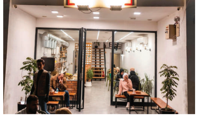
الفرع الأول - [الجادرية شارع الوزراء] Branch 1 – Al-Jadriya, Ministers Street