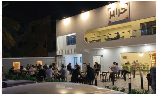
الفرع الثالث - [المنصور الداوودي] Branch 3 – Al-Mansour, Al-Dawoodi